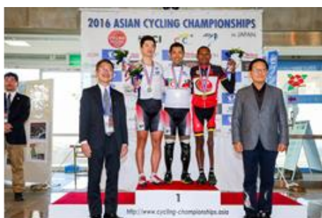
パラサイクリングMC1-5(22.4KM)表彰