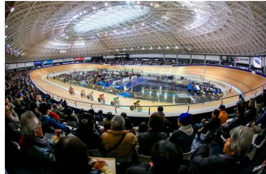
場内は立ち見が出る程の来場者に激励 されながら熱戦が繰り広げられた。