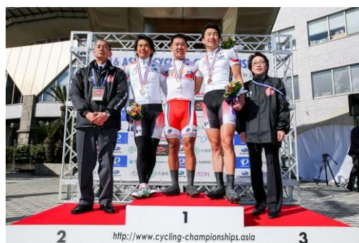
ロード男子エリート表彰式東京都大島支庁にて