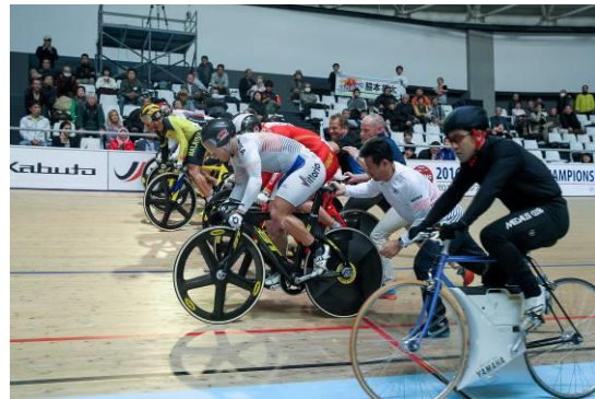
男子エリートケイリンスタート