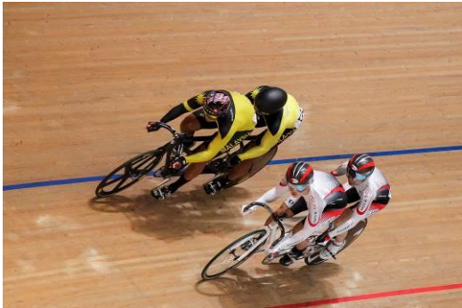
迫力のパラサイクリングトラック MB タンデムスプリントマレーシア チーム対日本チーム