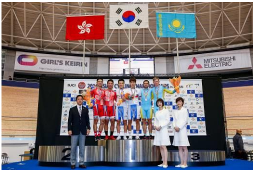
男子エリートマディソン表彰式